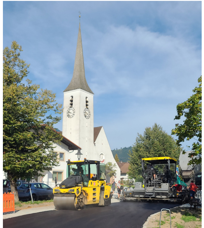
Foto: Aufbringen der Feinschicht vor der Sparkasse

Um die Pflasterflächen vor Asphalt-Abdrücken der Reifen zu schützen, bleibt vorübergehend noch eine Sandschicht auf den entsprechenden Flächen. Wenn die Asphaltdecke abgetrocknet ist, werden die Flächen vom Sand gereinigt.